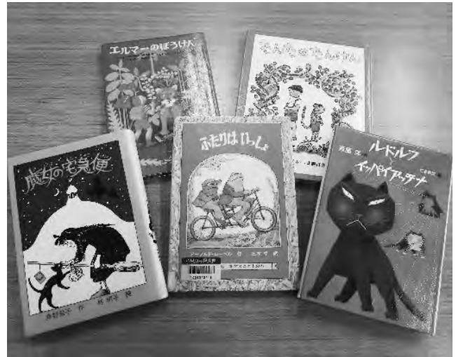
司書のおすすめ本のセットの例