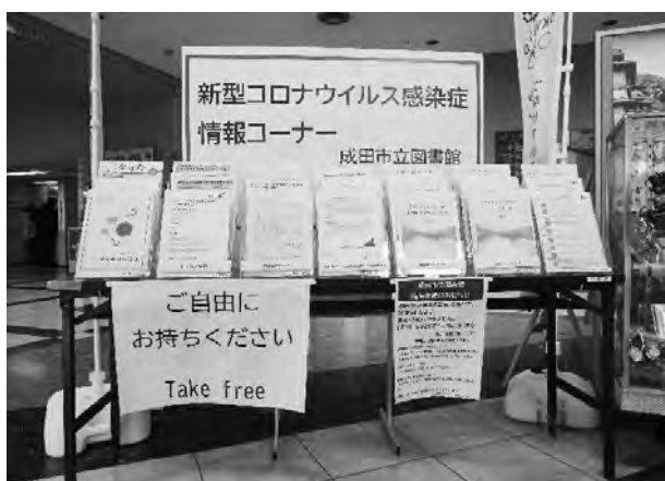
市役所本庁舎玄関ホールでの展示の様子

市役所の本庁舎玄関ホールに、新型コロナウイルス感染症に関する情報コーナーを設置し、関連資料の配布を行いました。