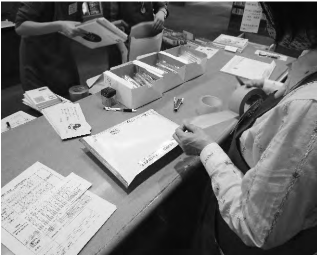
本を梱包している様子

受付開始直後から、たくさんの申込みがあり、初日だけで190件を超える利用がありました。また、新聞やテレビにも取り上げられ、大きな反響があり、利用した子どもたちからはお礼の手紙が寄せられました。最終的には、合計448名の利用がありました。