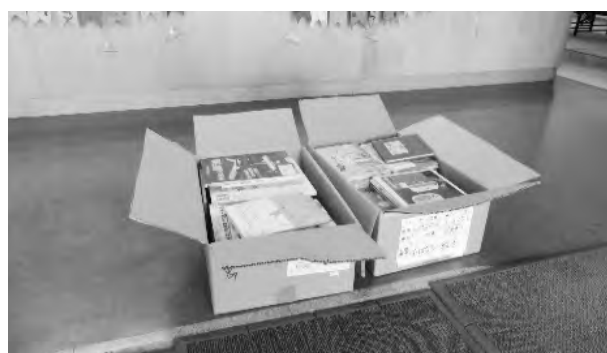
児童ホームへ本を配送した様子

休校により預かり時間が長くなっている児童ホームで役立ててもらうため、希望のあった市内17か所の児童ホームへ、リサイクル図書の提供を行いました。