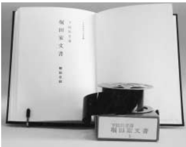
(A5判・119頁の解説目録付き 1989年・雄松堂フィルム出版発行)