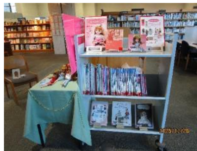
【しあわせのリカちゃん展】