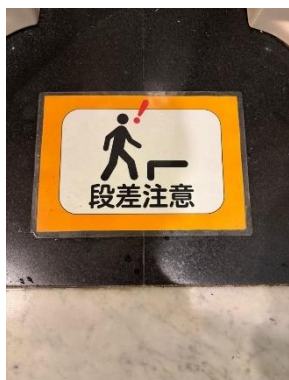
【男子トイレ段差注意】