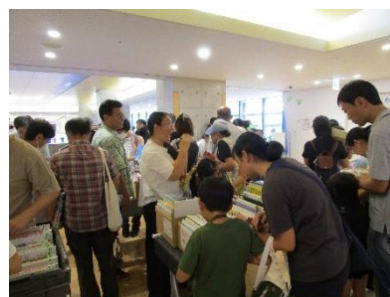
【「リサイクルフェア」の様子】