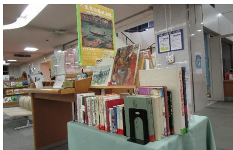
【千葉県移動美術館】