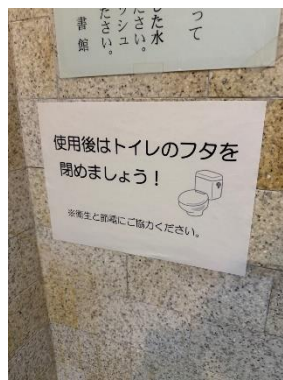
【男女トイレ フタを閉めましょう案内】