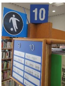
【ピクトグラムによる書架案内板】

利用者の利便性の向上および活字による認識が困難な方のために、ピクトグラムによる書架案内板を設置した。(13枚)