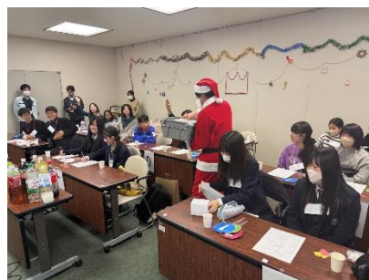
【アオハルクリスマススイブイブパーティー】