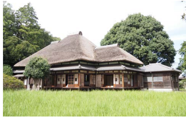
② 貴賓館 (成田市三里塚、三里塚記念公園内)