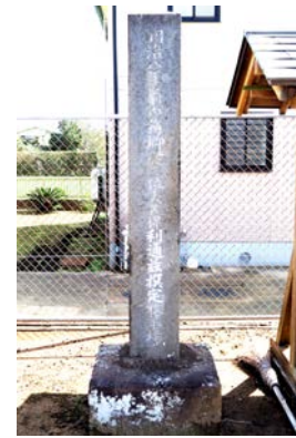
④ 大久保卿牧羊場選定の碑 (富里市御料、豊受神社内)