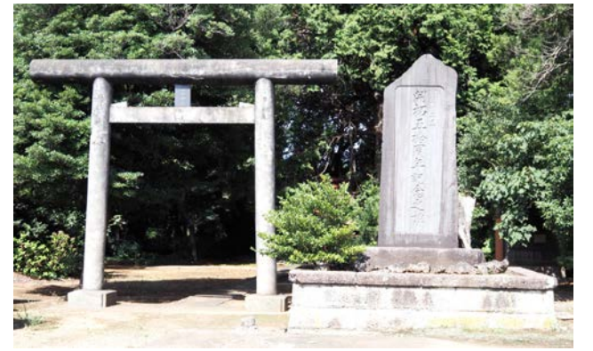
⑤ 神明神社と開拓五十周年記念碑 (富里市十倉)