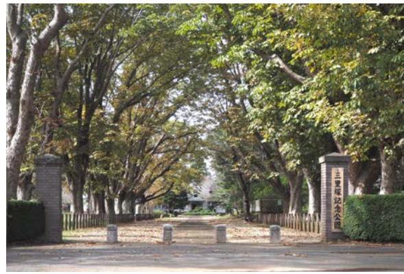
① トチノキの並木 (成田市三里塚、三里塚記念公園内)