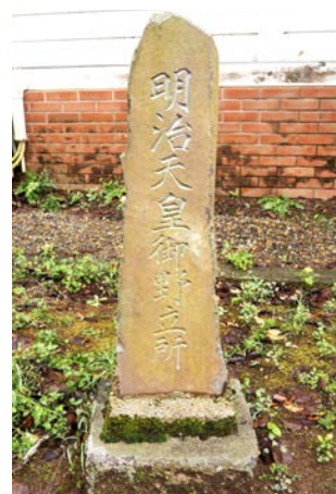
⑨ 「明治天皇御野立所」碑 (成田市三里塚、三里塚記念公園内)