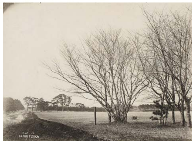
⑧ 駒之頭の御幸桜 (成田市東峰、成田国際空港用地内。宮内庁宮内公文書館所蔵「明治天皇大嘗祭御齋田主基ノ地写真他」より)