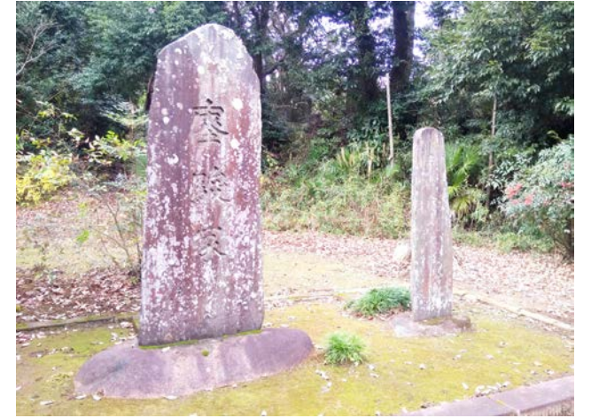
⑥ 「えい駿塚」と「名馬吾妻の塚」 (芝山町、芝山仁王尊観音教寺内)