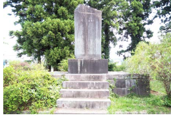
③ 下総種畜場大久保公遺徳碑 (富里市十倉、神武神社内)