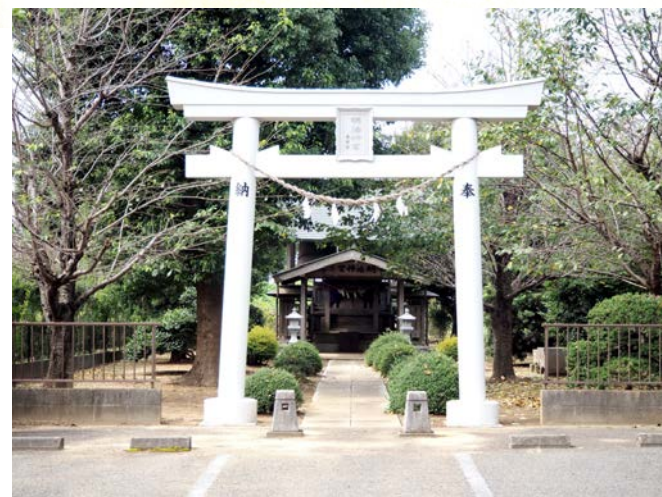
⑦ 明治神宮遥拝所 (成田市川上)