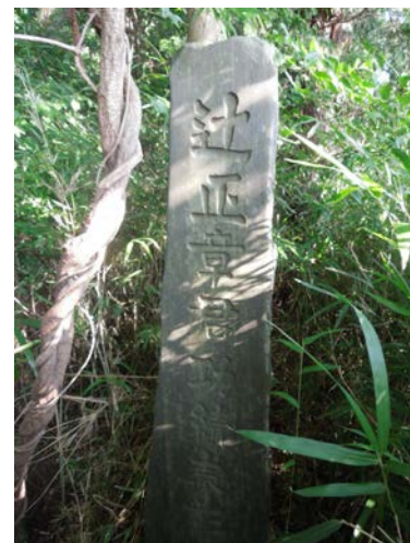
⑩ 辻正章の顕彰碑 (成田市小菅)